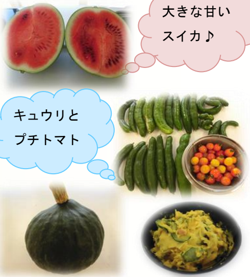
大きな甘いスイカ♪