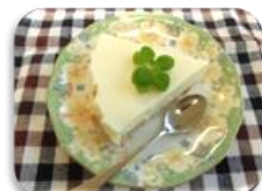
レアチーズケーキ